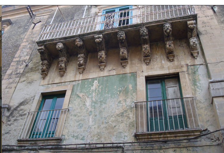
CAMPIONE N. 1 Via Carlo Alberto n. 16-18-20-22