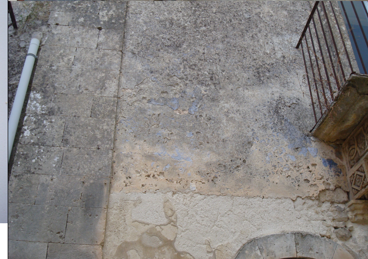
CAMPIONE N. 3 Via Machiavelli angolo Via Carlo Alberto