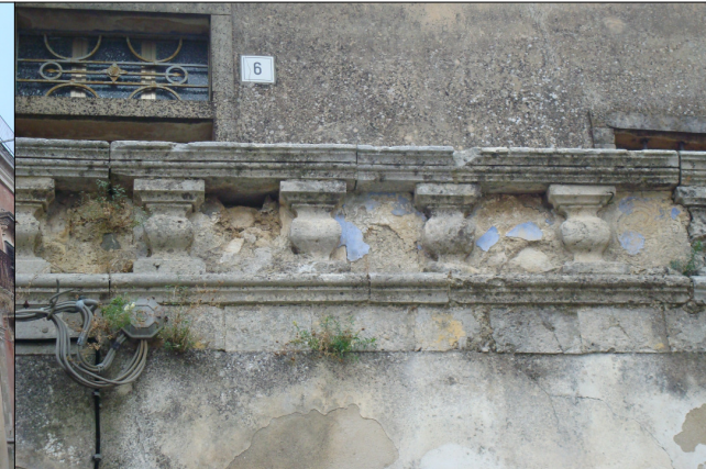
CAMPIONE N. 4 Via Acre n. 6-10-12-14-16