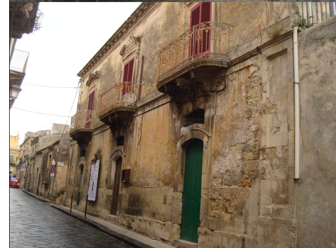
CAMPIONE N. 5 Via Gaetano Italia n. 62-64-66-68-70 angolo Via Carnevale