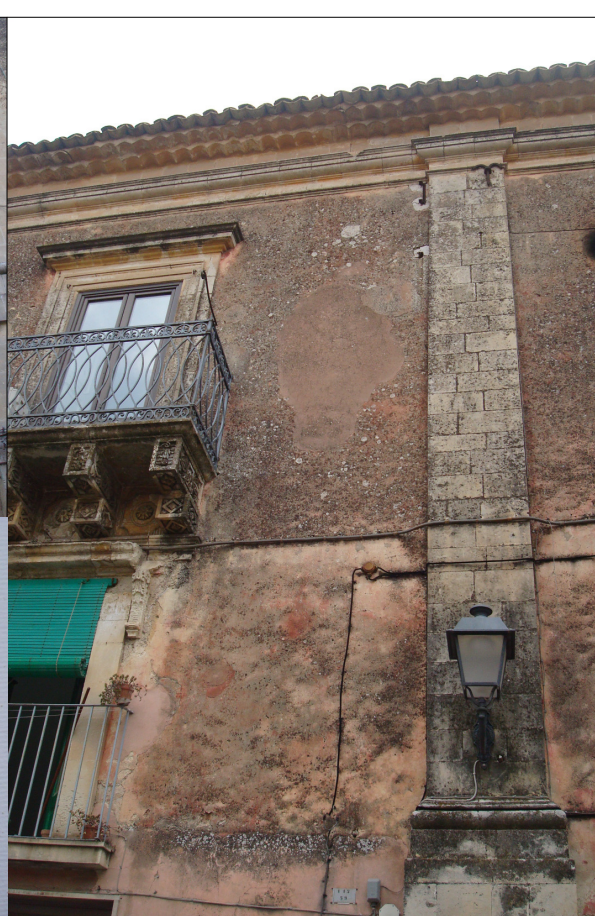
CAMPIONE N. 2 - Via Carlo Alberto n. 48-50-52